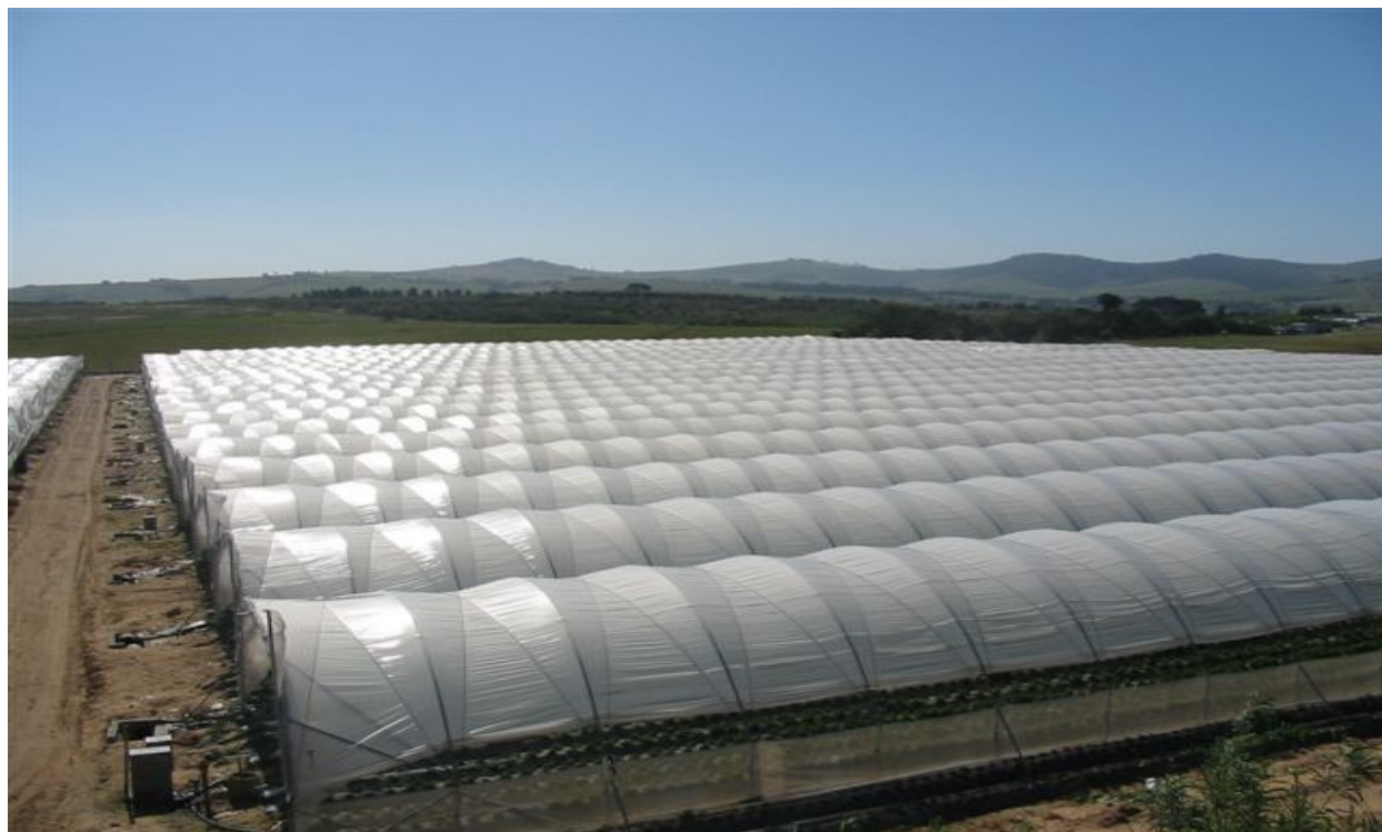
➤ Foto e seres në formë të tunelit