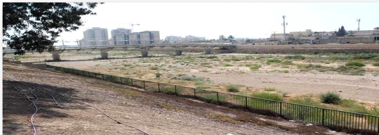
➤ Foto e lumit që e ndan zonën rurale nga zona urbane

Bear Sheva shtrihet në veri të shkretëtirës Negev, është qyteti i shtatë më i madh në Izrael, me 194,300 banorë, pjesa më e madhe përbëhet nga hebrejt të cilët imigruan nga vendet arabe pas vitit 1948, ky numër është rrit nga viti 1990 prej emigrantët nga Etiopia dhe ish-Bashkimi Sovjetik. Qyteti u themelua nga ana e Izraelit gjatë shekullit të 10-të dhe ka qenë i banuar për mijëra viteve për shkak të pranisë së rezervave të ujit. Lumi kryesor është Nahal, i cili përmytet në dimer, kurse shterron në verë. Ky lumë e ndan pjesën urbane nga pjesa rurale. Në pjesën rurale planifikohen ndërtimet e reja të shtëpive të orientuara në drejtim të parkut. Në hyrje të parkut dhe lumit, do të ndërtohet një pjesë me mbetje historike si dhe katër qendra të reja tregtare që do të përfshijnë një sipërfaqe prej 115,000 m 2 , pastaj pishina, sistemi për të mbledhur ujin e shiut si dhe ndriçimi nga panelet solare mbi pullaze. Pranë parkut parashifet shtigjet e bicikletave me distancë prej 8.000 metra, tregu i mbyllur me 400 hapësira për shitës i rrethura me gjelbrim si dhe stacioni i autobusave për qytetin i cili do të përmbanë dyqane dhe kafene brenda tij. Qyteti është duke kaluar një fazë të ndërtimit, e cila përfshin dy elemente të dizajnit urban të tilla si burimet e ujit, urat, terenet sportive dhe parqe.