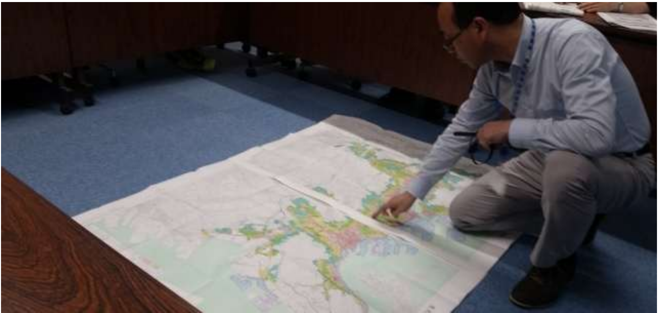
Foto e profesorit nga ligjërata

Fillimisht Zonimi propozohet nga zyra përkatëse e Qytetit, për të cilin Vendimi përfundimtar për përcaktimin e zonave merret nga Qyteti (autoritetet vendimmarrëse përkatëse). Paraprakisht propozimi kontrollohet nga Këshilli i Ekspertëve (pjesë e të cilit është edhe profesori), në një proces ku janë të përfshirë të gjitha palët e interesit.