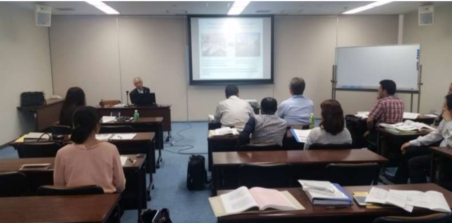
Foto nga ligjërata

Qyteti Kitakyushu është njëri nga 20 qytetet që kanë një status të veçantë dhe bashkë me 47 prefekturat përbëjnë ndarjen kryesore hapësinore të shteti të Japonisë.