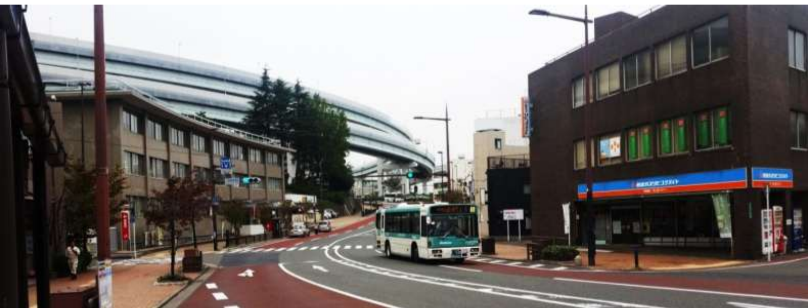
Foto nga terreni – njëra nga rrugët e zakonshme të qytetit me sinjalistikën e nevojshme.

Transporti publik është njëri nga funksionet me ndikimin më të madh në statusin e qytetit të qëndrueshëm. Sot në Kitakyushu janë në funksion të gjitha llojet e transportit dhe të gjitha me bilanc pozitiv të zhvillimit. Ky nivel është arrit me angazhim dhe përkushtim të të gjitha strukturave vendimmarrëse të qytetit, të cilët për bazë e kanë pas Strategjinë për rigenerimin e transportit publik të v. 2008.