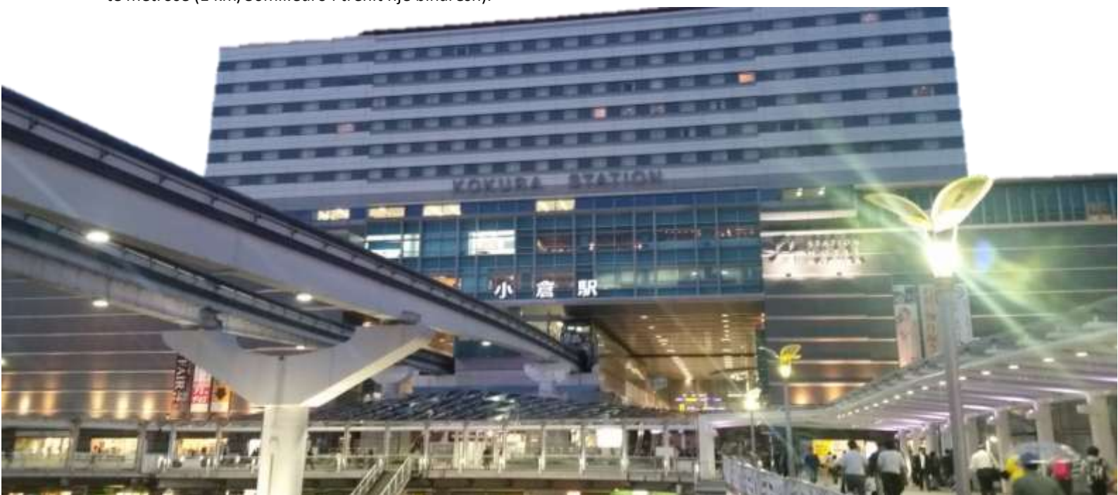
Foto e Stacionit Kokura, njërit nga stacionet e trenit njëbriarësh

Pjesë e transportit publik është edhe hekurudha, e cila në Kitakyushu është e disa formave. Nëpër qytet kalon treni më i shpejtë japonez “Shinkanse” që e lidhë të gjithë gati të gjithë Japoninë (pjesë e programit ishte një udhëtim prej Fukuoka deri në Kitakyushu – një përjetim shumë i veçantë). Treni një binarësh është gjithashtu pjesë e transportit publik, i cili e përshkon një pjesë të qytetit duke u mundësuar udhëtarëve udhëtim të qetë, të përshtatshëm, e duke pasur parasysh mënyrën e lëvizjes (treni lëvizë nëpër shtylla të cilat kalojnë mbi të gjitha rrugët e qytetit) edhe shumë i shpejtë. Arsye e përzgjedhjes së kësaj forme të transportit publik është çmimi tre herë më i lirë nga çmimi i ndërtimit të metrosë (1 km/80mil.euro i trenit një binarësh).