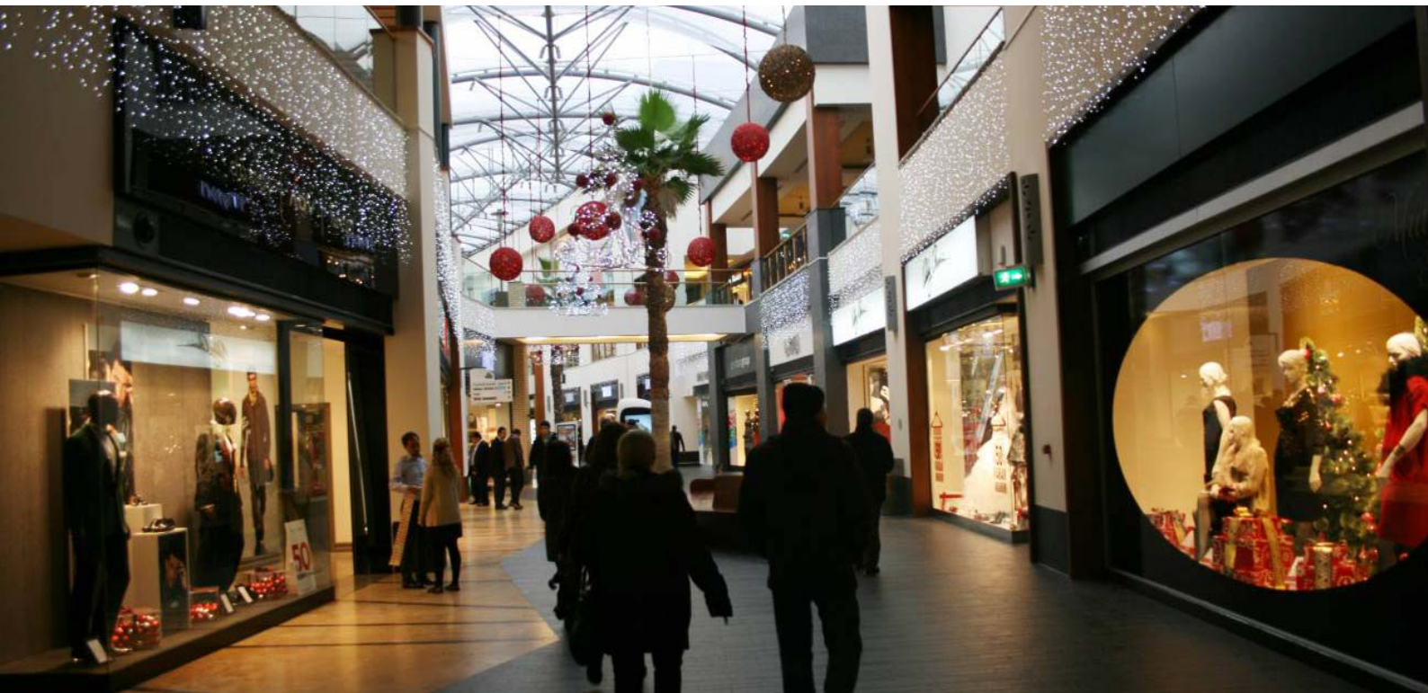
Foto nga brenda e qendrave të vizituara