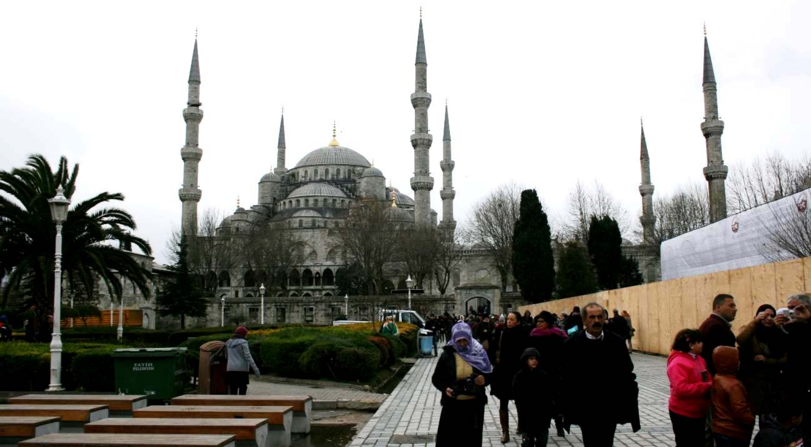
Foto e xhamisë nga jashtë