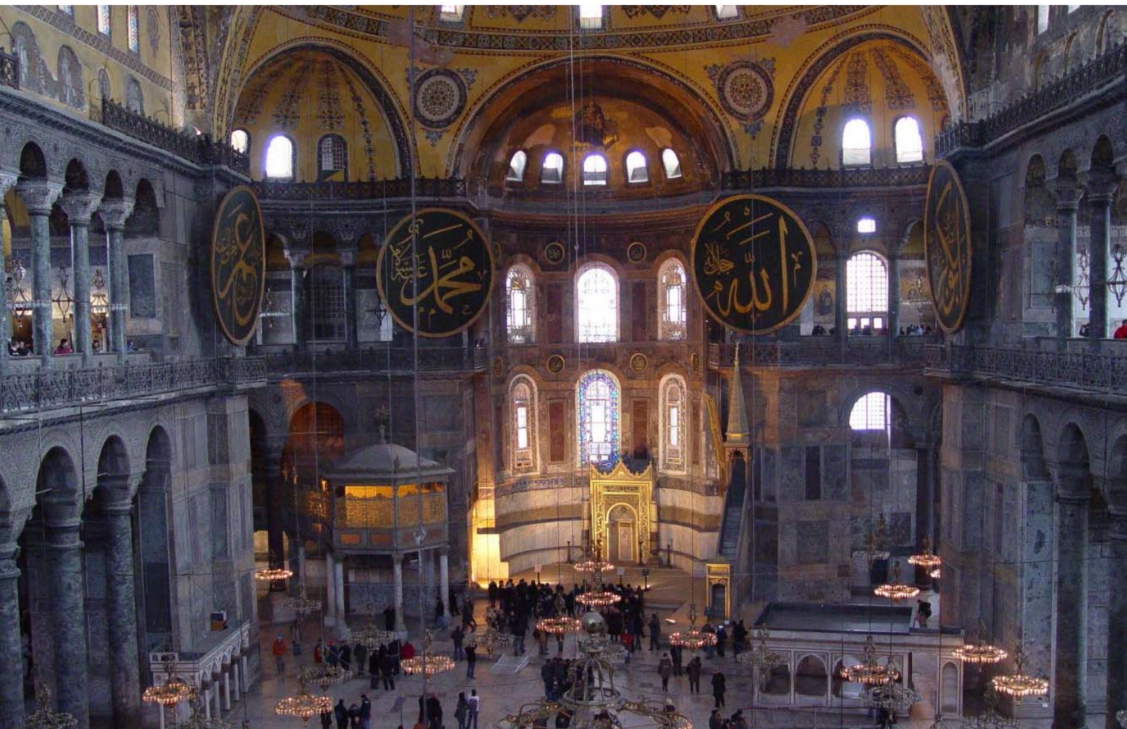
Foto Aja Sofia nga brenda