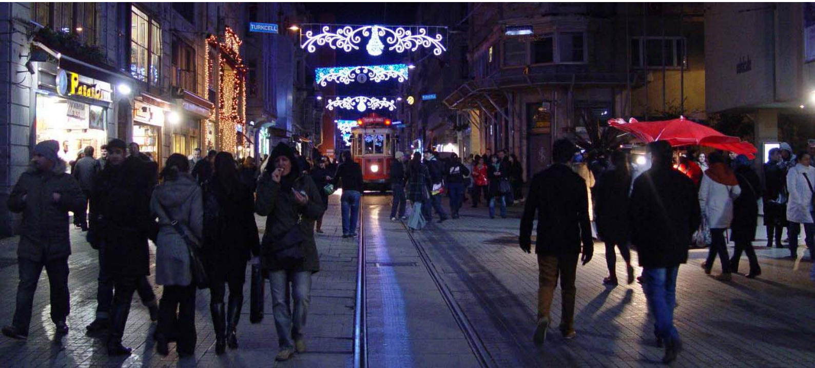
Foto nga rruga Taksim

Një përjetim i veçantë ishte vizita që i kemi bërë lagjes Taksim, njëres nga rrugët më të njohura dhe më të shtrenjta në qytetin e Stambollit. U impresionuam shumë me arkitekturën e rrugës, me raportin e ndërtimeve të vjetra dhe ndërtimeve të reja. Pamja dhe gërshetimi me mjeshtri i tyre tregon për një traditë të gjatë dhe të qëndrueshme të ndërtimit. Pamjen e bënin edhe më madhështore dekorimet dhe dritat e shumta që paralajmëronin festat e fund-vitit.