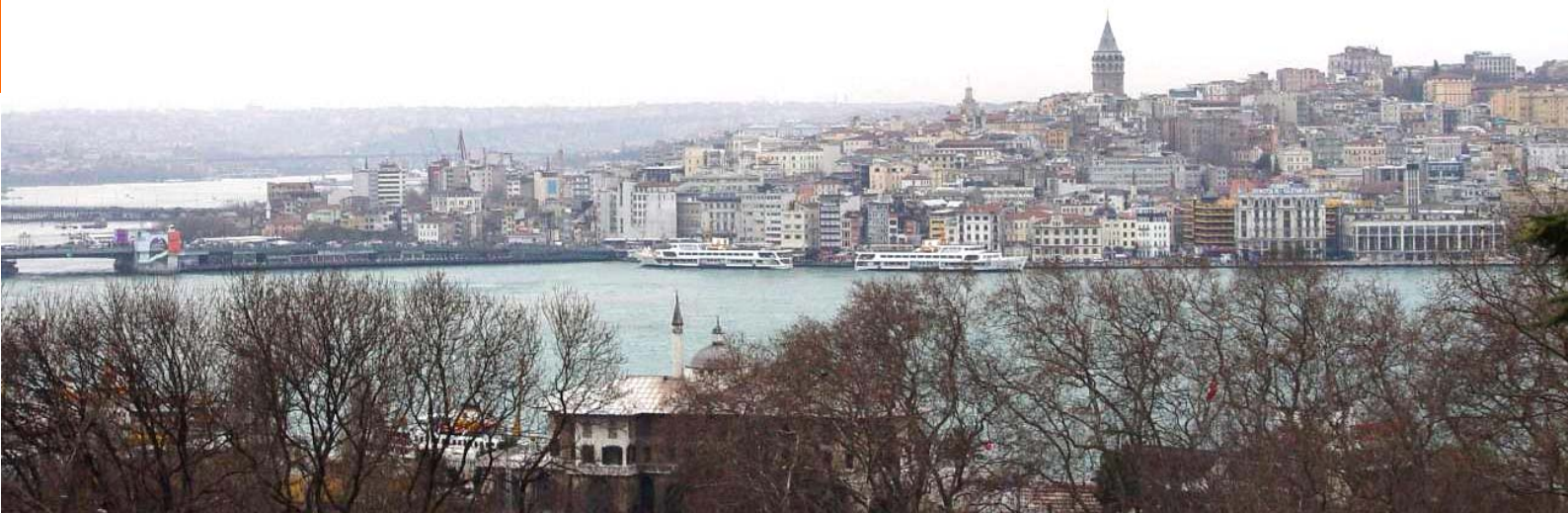
Foto e disa nga shtat kodrat e qytetit të Stambollit