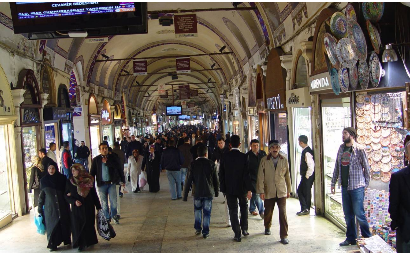
Foto të pazarit të vjetër

Kapali Çarshi - Çarshia e vjetër e Stambollit apo siç njihet me emrin Kapali Çarshi është pika tjetër interesante që ne e vizituam. Kapali Çarshi është njëri nga tregjet (pazaret) e mbuluar më të vjetër dhe më të mëdhenj në botë me 58 rrugë të mbuluara dhe 4000 dyqane që vizitohen nga 250.000 deri në 500.000 vizitorë në ditë. Ndërtimi ka filluar në vitin 1455 dhe pazari është hapur për blerësit në vitin 1461. Kapali Çarshi është i njohur për dyqanet e tij të argjendarisë, stolive të çmuara, artikujve të qeramikës, të erëzave dhe të tepihëve. Shumë stenda në pazar janë të grupuara sipas llojit të mallit me vende të veçanta për xhaketa të lëkurës, stoli të arit dhe të ngjashme. Pazari përmban edhe dy struktura me kube, të ndërtuara për deponim të mallit dhe për ruajtje të sigurt. E para prej tyre është ndërtuar midis viteve 1455 dhe 1461 me urdhër të Sulltan Mehmetit Pushtuesit. Kapali Çarshi është zgjeruar shumë në shekullin XVI në kohën e Sulltan Sylejmanit Të Madhërishmit, kurse në vitin 1894 është restauruar për shkak të dëmtimeve nga tërmeti. Në këtë pazar të mbyllur sot gjenden edhe dy xhami, dy hamame, katër fontana, restorante dhe kafene. Kompleksi përbëhet nga 12 ndërtesa kryesore dhe ka 22 dyer.