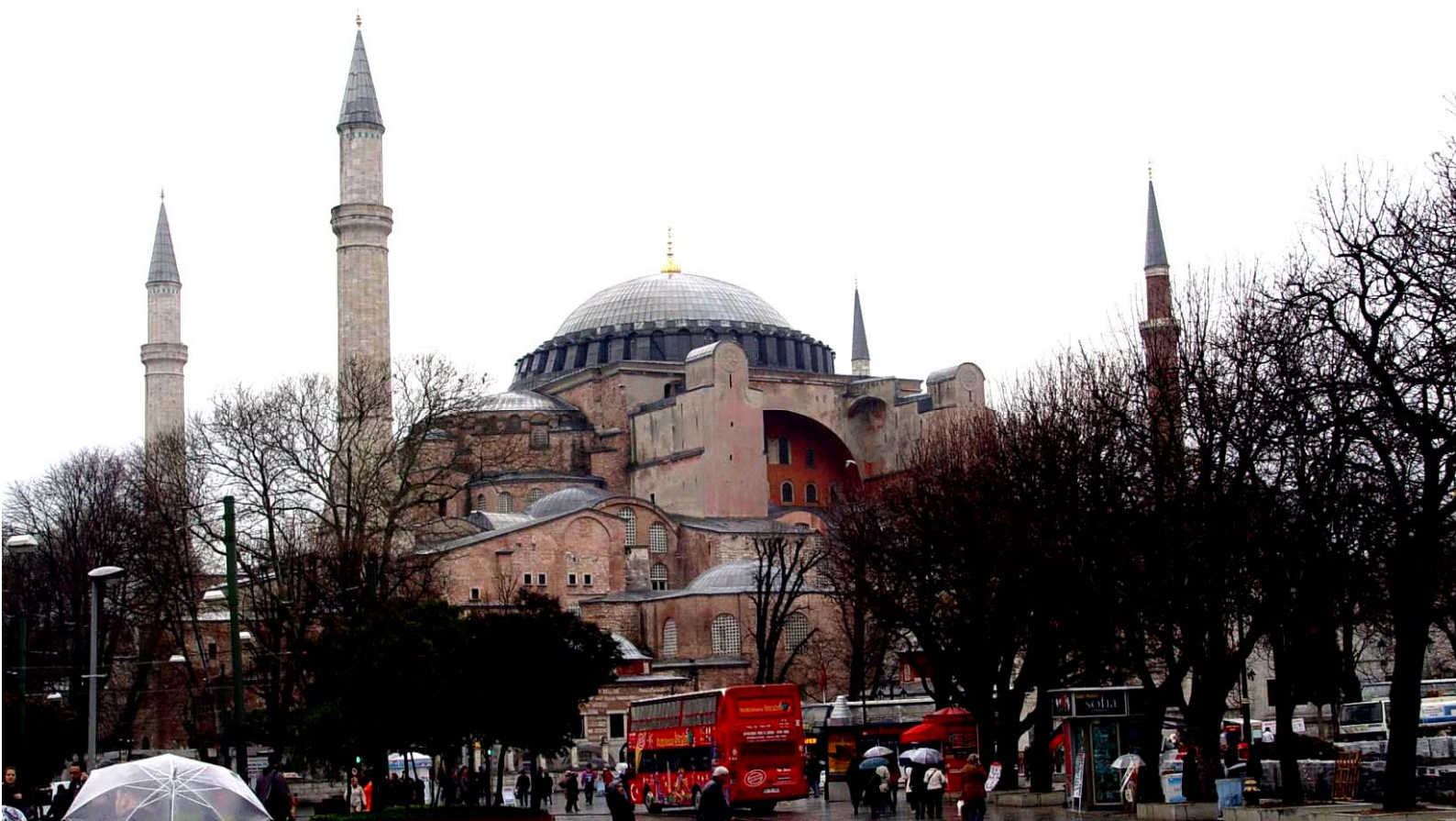
Foto Aja Sofia nga jashtë