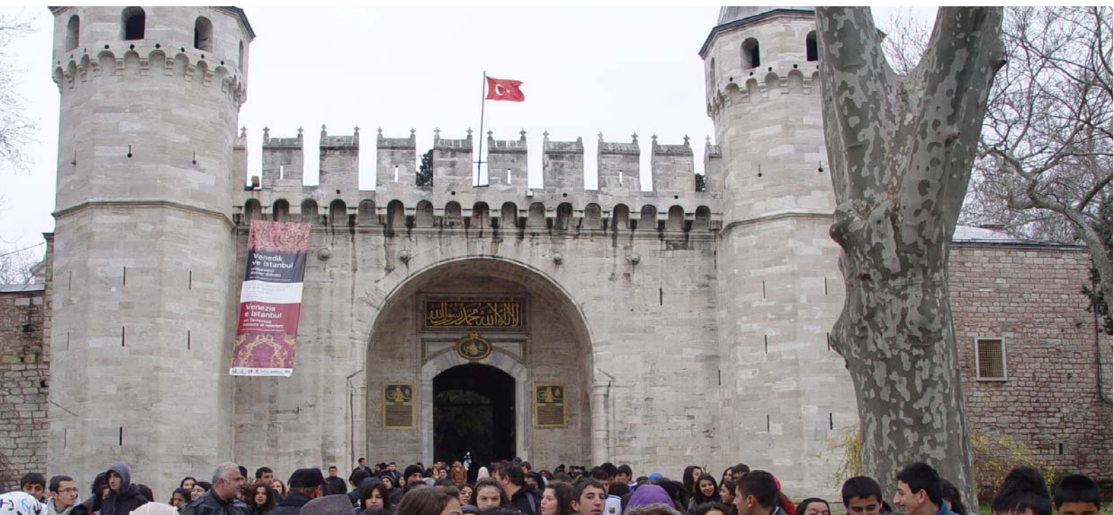
Foto e hyrjes në muzeun Topkapi