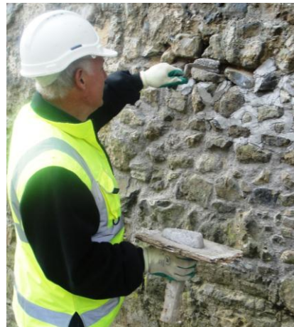
Fig. Monumenti mesjetar Kells Priory

Vizita tjetër u realizua në njërin nga ndërmarrjet lokale (KNOCKDRINNA FARM SHOP) që merret me prodhimin e produkteve të qumështit. Furnizimin me qumësht të lopëve, dhenve dhe dhive që ushqehen vetëm nga natyra, e realizon nga fermerët dhe blegtorët e fshatit. Kompania u themelua me iniciativë familjare me përkrahje të fondeve për zhvillim të komunitetit dhe është në funksionon që prej dhjet viteve, është fituese e shumë çmimeve vendore dhe ndërkombëtare. Aktualisht është njëra nga pikat më atraktive të vizitave zyrtare (në vendin 19 në nivel shteti), sot një pjesë e konsiderueshme e prodhimeve eksportohet edhe në Mbretërinë e Bashkuar.