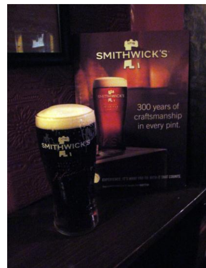
Fig. Birra Smithwick's

Njëra ndër vizitat më atraktive u zhvillua në fabrikën e birrës "Smithwick's Brewery". Grupi ynë ishim njëri nga grupet e para që po e vizitonte fabrikën pas ndryshimeve rrënjësore në menaxhim dhe marketing. Më shumë se 3.5 milion euro ishin investuar për prezantimin e të gjithë historisë të vjetër më shumë se 300 vite. Rritja e cilësisë së birrës (për mua deri më tash më e mira) dhe investimet në marketing kanë ndikuar në rritjen e dukshme të prodhimit dhe shtimin e numrit të vizitorëve, nga të cilët përfiton i gjithë qyteti i Kilkenit.