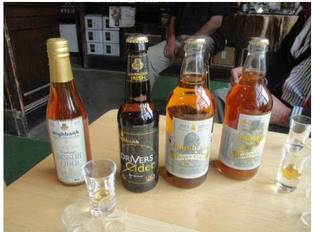
Fig. Ferma e mollëve organike

Njëra ndër vizitat më atraktive u zhvillua në fabrikën e birrës "Smithwick's Brewery". Grupi ynë ishim njëri nga grupet e para që po e vizitonte fabrikën pas ndryshimeve rrënjësore në menaxhim dhe marketing. Më shumë se 3.5 milion euro ishin investuar për prezantimin e të gjithë historisë të vjetër më shumë se 300 vite. Rritja e cilësisë së birrës (për mua deri më tash më e mira) dhe investimet në marketing kanë ndikuar në rritjen e dukshme të prodhimit dhe shtimin e numrit të vizitorëve, nga të cilët përfiton i gjithë qyteti i Kilkenit.