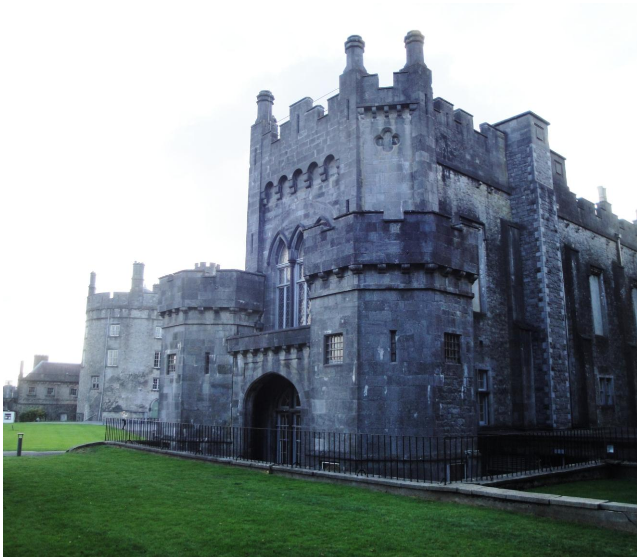
Fig. Kështjella e Kilkenit (shek. XII)

Sot, Irlanda vazhdon të jetë vend i prosperitetit vend i traditës dhe i shanseve për të gjithë.