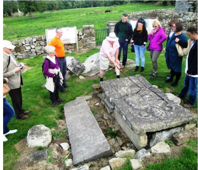
Fig. Vizita në "Qytetin e Humber"

Ferma e mollëve organike (Highbank Organic Farm) ishte pika tjetër e vizitës tonë. Edhe kjo ndërmarrje është rezultat dhe iniciativë familjare dhe kontribuuesi rëndësishëm në marketingun e përgjithshëm të Kilkenit. Në fermën me sipërfaqe prej 20 Ha prodhohen disa varietete mollësh organike, që kryesisht shfrytëzohen për prodhime të ndryshme, nga të cilat uthulla dhe lëngjet ishin më të njohura, të gjitha me shenjë e prodhimit të licencuar organik 2 . Puna e mirë që realizohet në këtë fermë është rezultat i funksionimit shumë të mirë të rrjetit të bashkëpunimit, pa të cilin është vështirë të mbijetohet. Moto e këtij rrjeti është "ushqimi i ngadalshëm" (slow food) që ka për qëllim shmangien nga ushqimet e shpejta (fast food) dhe të dëmshme për shëndetin.