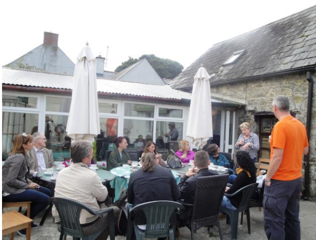
Fig. Pauza në ndërmarrjen e prodhimeve të qumështit

Vizita tjetër u realizua në njërin nga ndërmarrjet lokale (KNOCKDRINNA FARM SHOP) që merret me prodhimin e produkteve të qumështit. Furnizimin me qumësht të lopëve, dhenve dhe dhive që ushqehen vetëm nga natyra, e realizon nga fermerët dhe blegtorët e fshatit. Kompania u themelua me iniciativë familjare me përkrahje të fondeve për zhvillim të komunitetit dhe është në funksionon që prej dhjet viteve, është fituese e shumë çmimeve vendore dhe ndërkombëtare. Aktualisht është njëra nga pikat më atraktive të vizitave zyrtare (në vendin 19 në nivel shteti), sot një pjesë e konsiderueshme e prodhimeve eksportohet edhe në Mbretërinë e Bashkuar.