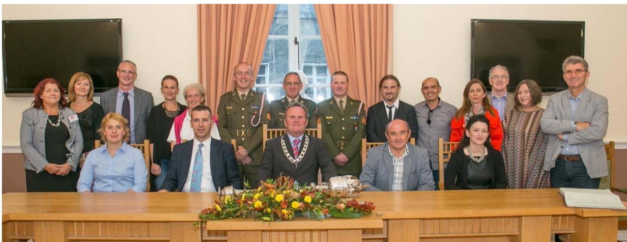
Fig. Takimi në Këshillin komunal në Kilkeni

Takimi u mbajt në ndërtesën e Këshillit komunal (shekulli XVII), nën udhëheqjen e nënkryetarit si nikoqir i takimit, i cili më shumë kompetencë foli dhe na ofrojë të dhëna të ndryshme për komunën dhe rregullimin e sajë. Sipas rregullimit aktual administrativ hapësinor, autoriteti i këshillit të rajonit të Kilkenit (90.000 banorë) ka ndikim vendimmarrës për çështjet dhe projektet shtetërore, për dallim nga këshilli komunal (25.000 banorë) që është përgjegjës për shërbimet, rregullimin hapësinor, infrastrukturën dhe projektet tjera me ndikim lokal. Pjesë e takimit ishin edhe përfaqësues të forcave mbrojtëse, që për rastësi në një periudhë kohore kishin qenë edhe pjesë e forcave të NATO-s në Kosovë.