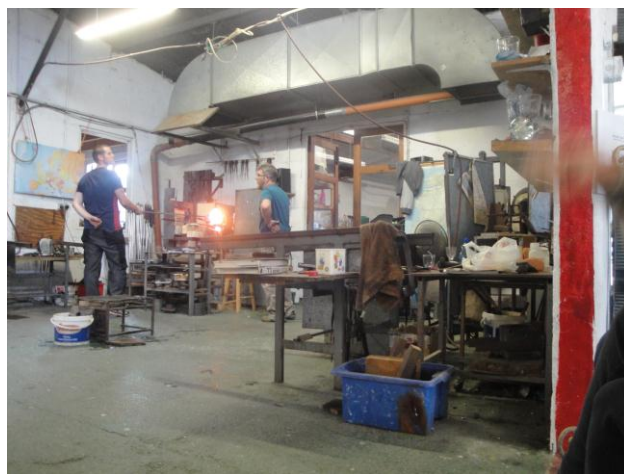
Fig. Ndërmarrja për përpunimin e qelqit

Në vazhdim të vizitave u njoftuam me ndërmarrjen lokale për përpunimin e qelqit (Jerpoint Glass Studio) që është një aktivitet tradicional i kësaj familje. I gjithë grupi u bëmë dëshmitar të një procesi prej fillimit e deri në fund të përpunimit me dorë të një vazoje unike qelqi.