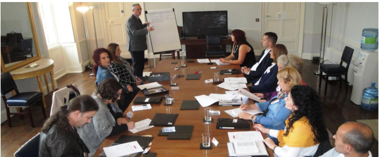
Fig. Takimi në zyrën qendrore të Këshillit

Edukimi është gjithashtu një fushëveprim i rëndësishëm i Këshillit, i cili përmes programeve të ndryshme lokale dhe qendrore promovon dhe ndikon në ngritjen e vetëdijes për mirëmbajtjen dhe ruajtjen e trashëgimisë natyrore dhe kulturore. Një kontribut të veçantë në këtë drejtim ofrojnë zyrtarët e trashëgimisë që janë të shpërndarë në të gjithë vendin. Përmes forumeve të trashëgimisë kulturore lokale, në të cilat janë të përfshirë të gjitha strukturat dhe nivelet e shoqërisë (mesatarisht 30 anëtarë) duke i përfshirë edhe politikanët, arrihet të artikuloohen nevojat buxhetore dhe hapat e nevojshëm për ruajtjen dhe shfrytëzimin e qëndrueshëm të trashëgimisë. Një shembull i këtij bashkëpunimi është Projekti i varrezave të vjetra i cili për qëllim ka identifikimin dhe sigurimin e shënimeve të sakta për to.