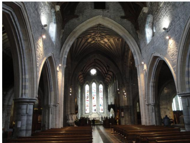
Fig. Katedralja e St. Canice's